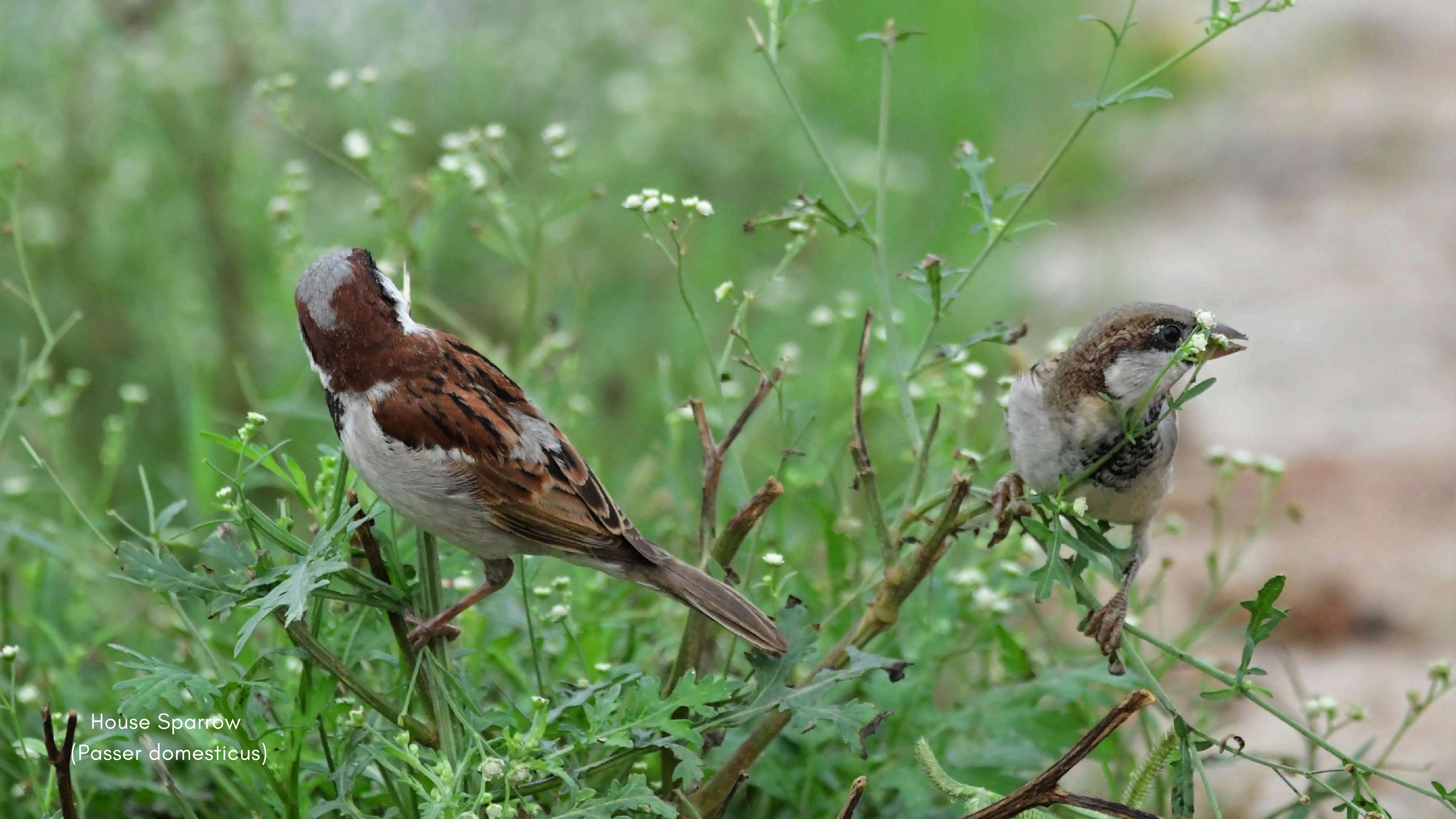
House Sparrow ( Passer domesticus )