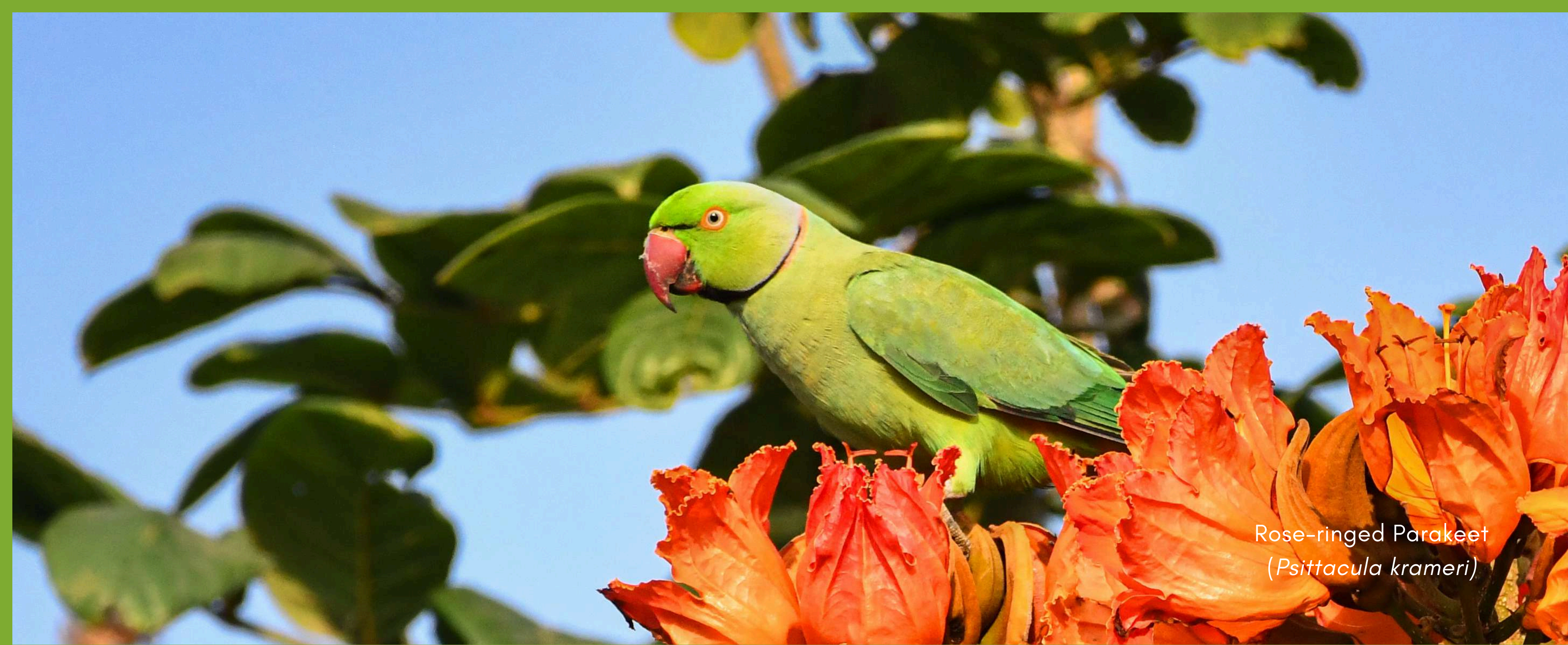
Rose-ringed Parakeet ( Psittacula krameri )