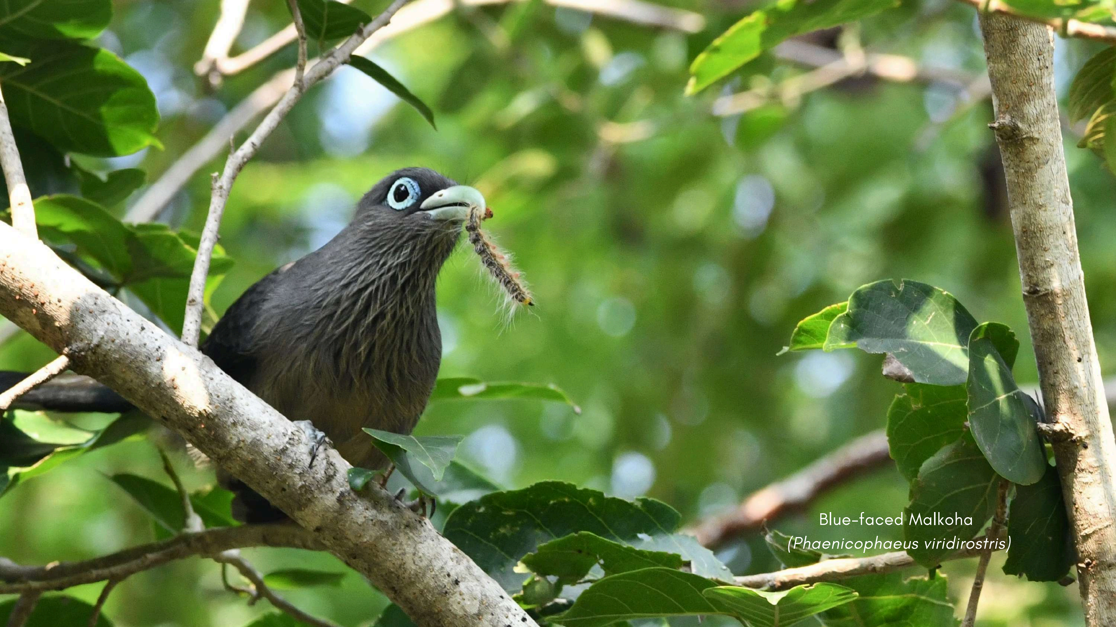
Blue-faced Malkoha ( Phaenicophaeus viridirostris )