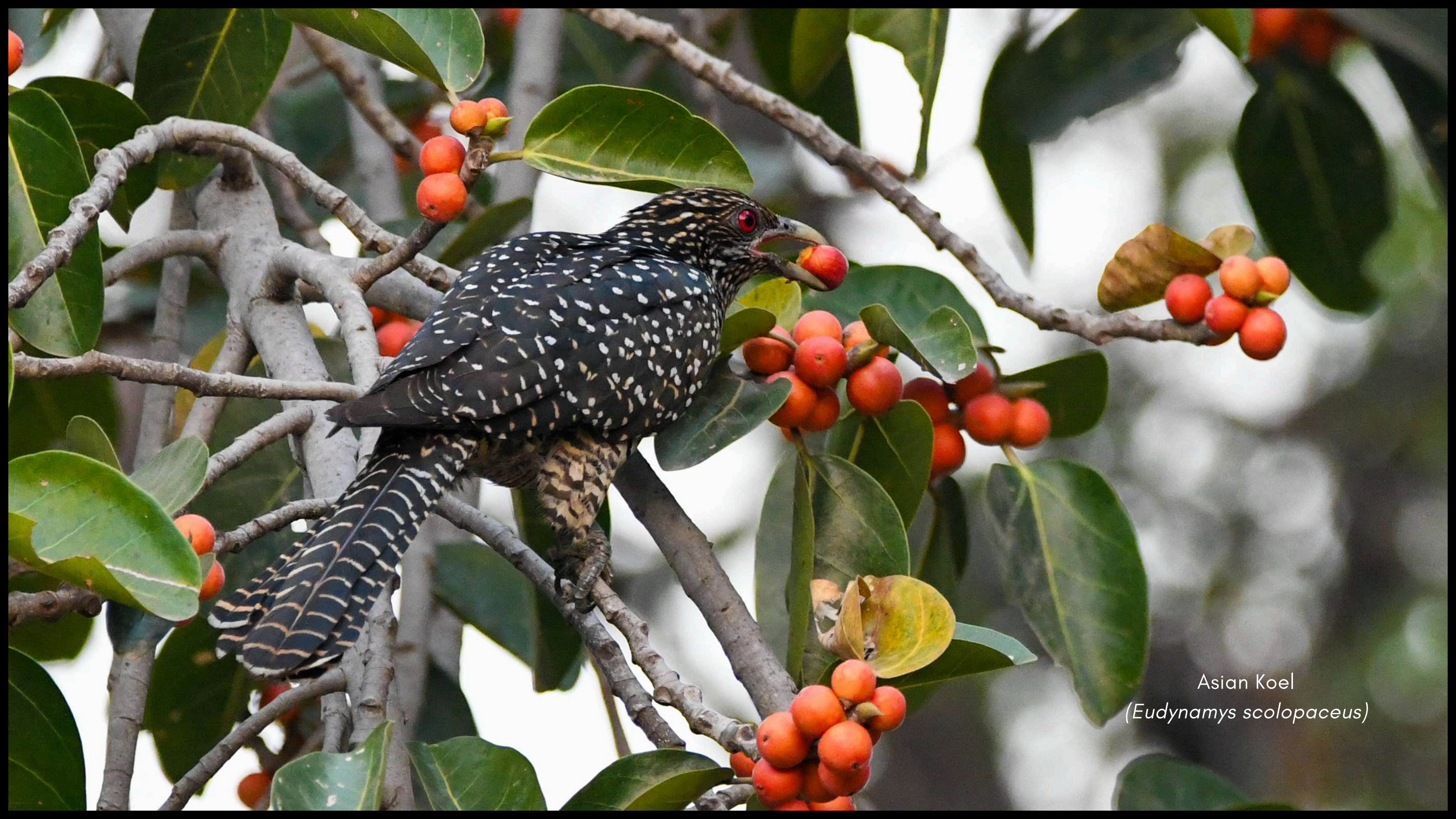
Asian Koel ( Eudynamys scolopaceus )