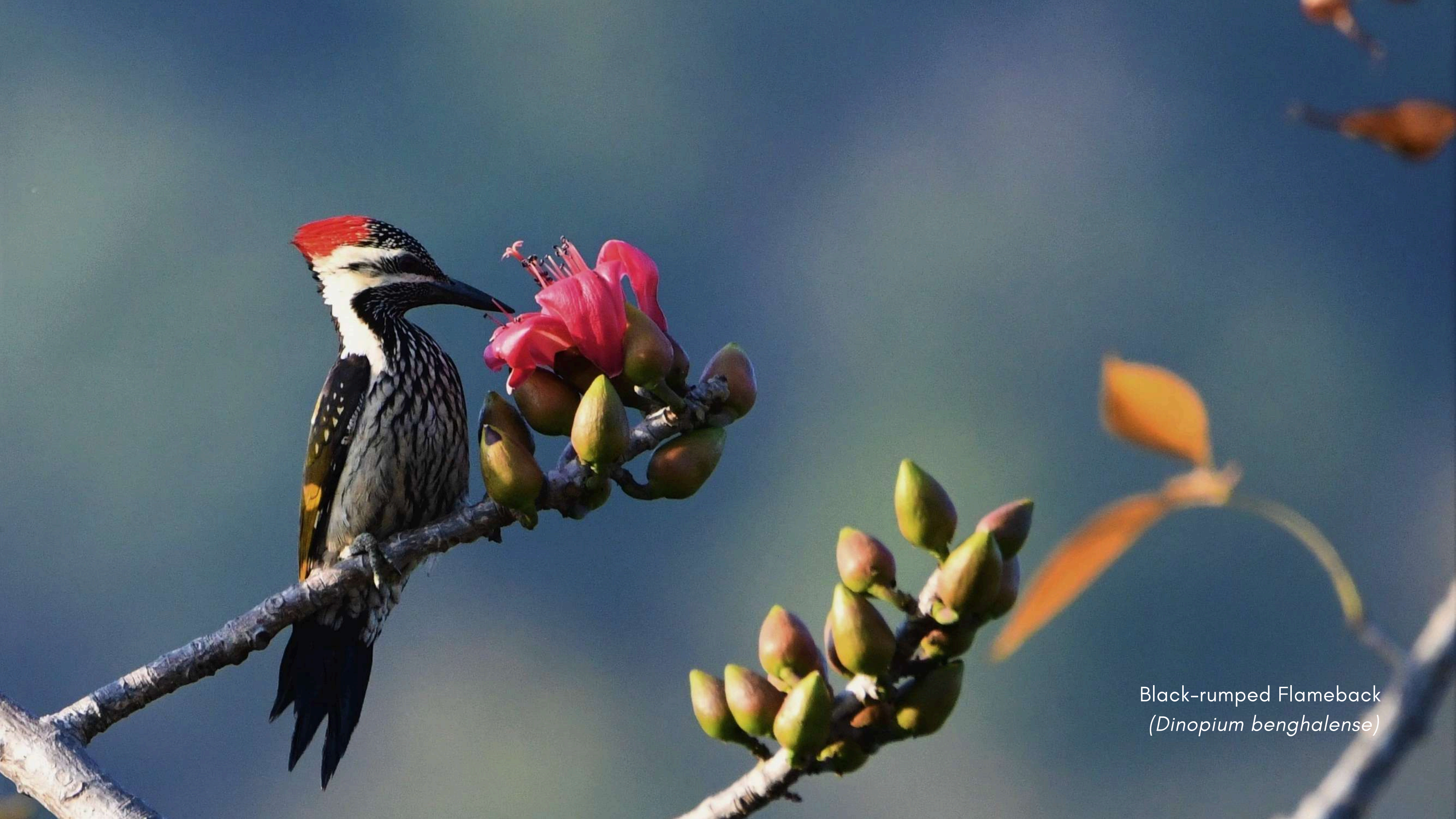
Black-rumped Flameback ( Dinopium benghalense )