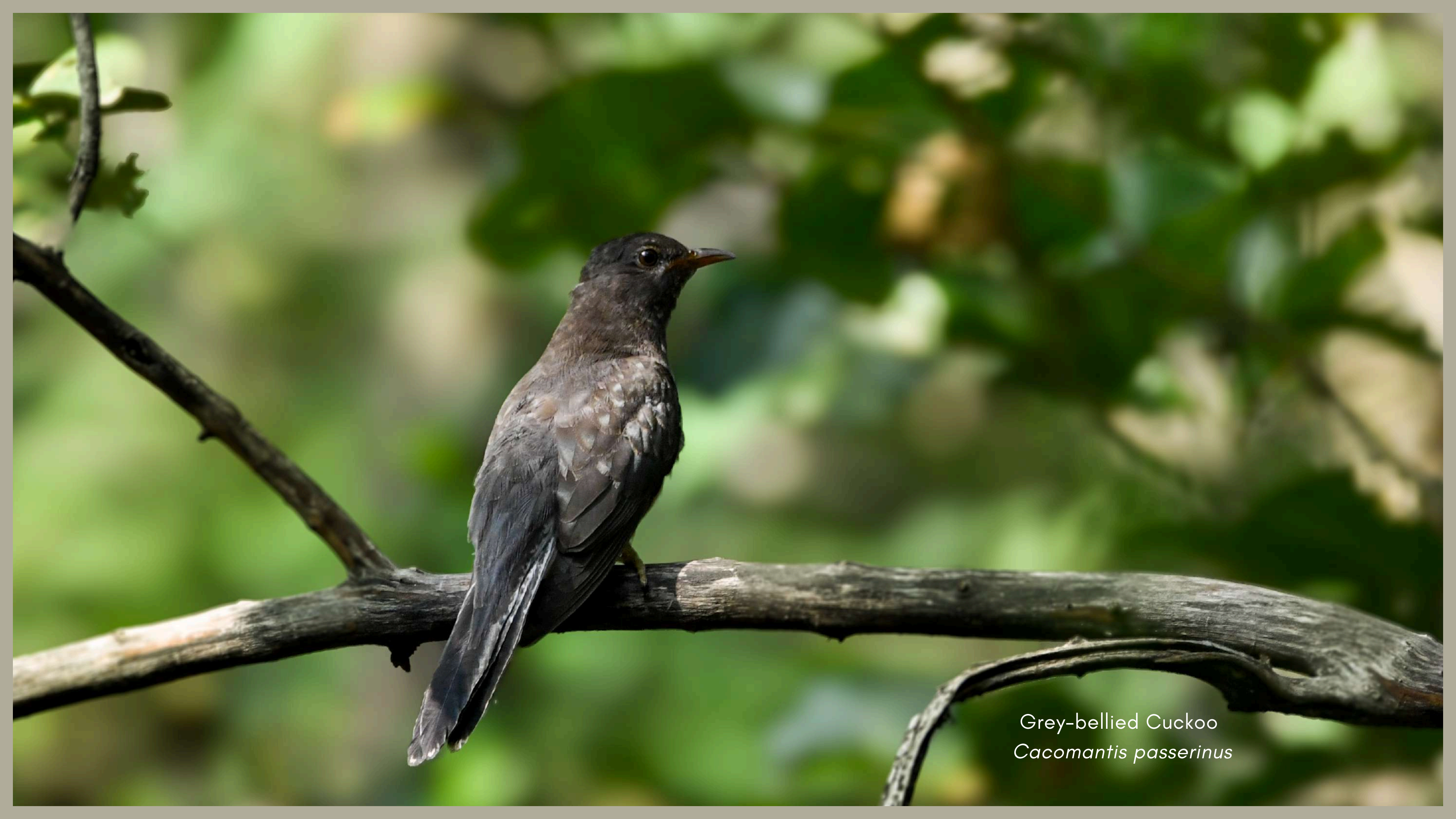
Grey-bellied Cuckoo Cacomantis passerinus