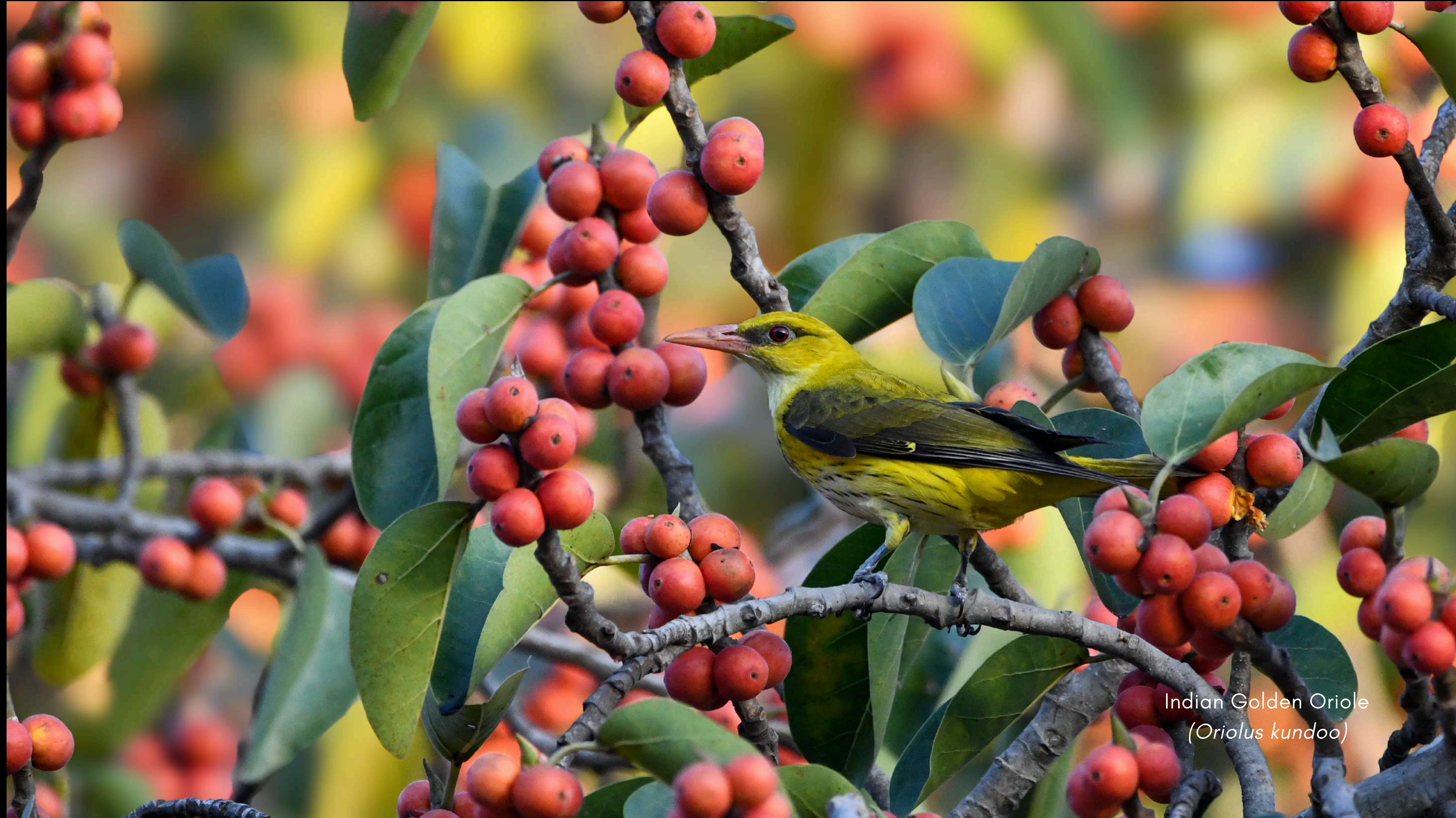
Indian Golden Oriole ( Oriolus kundoo )