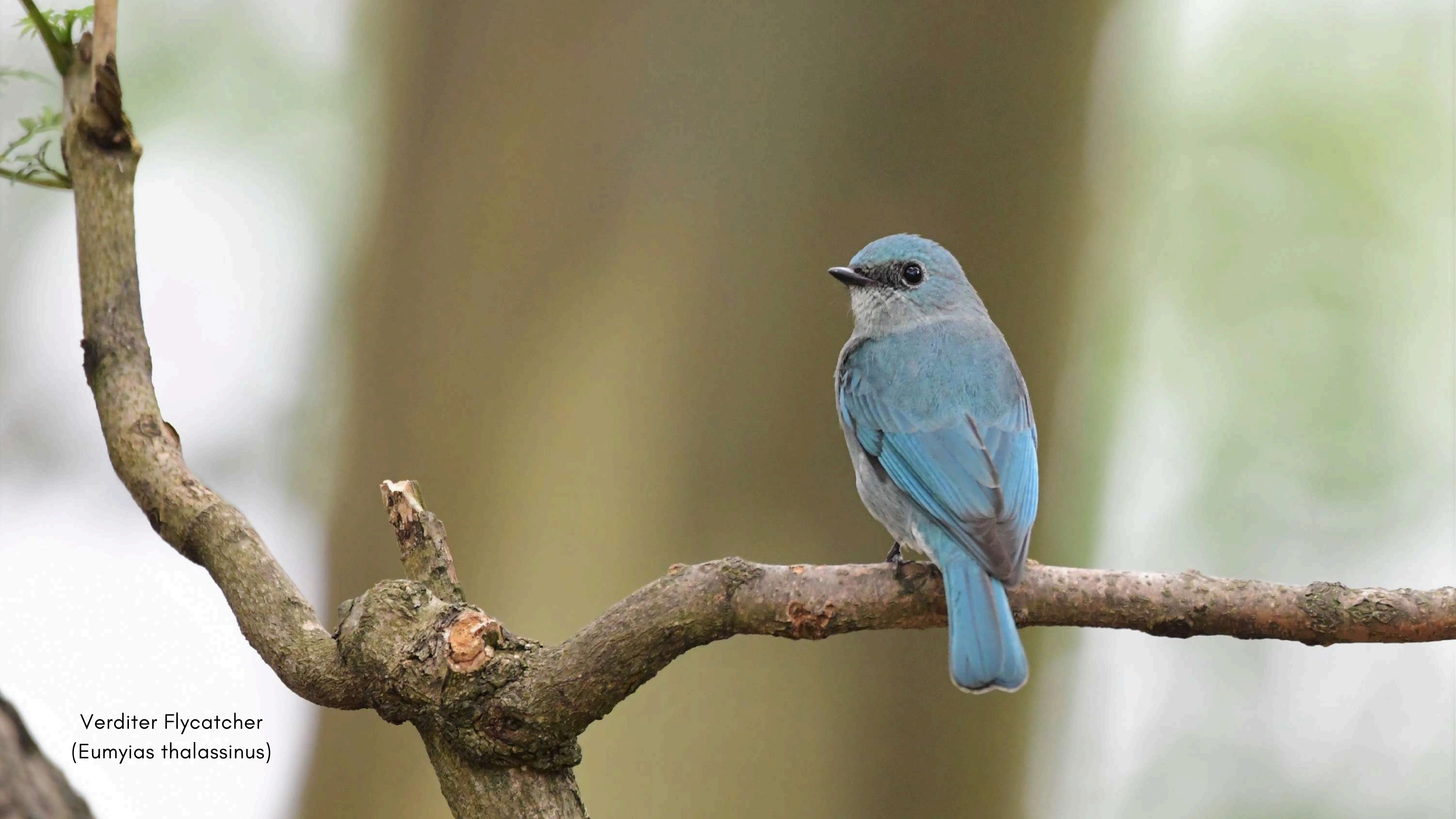
Verditer Flycatcher ( Eumyias thalassinus )