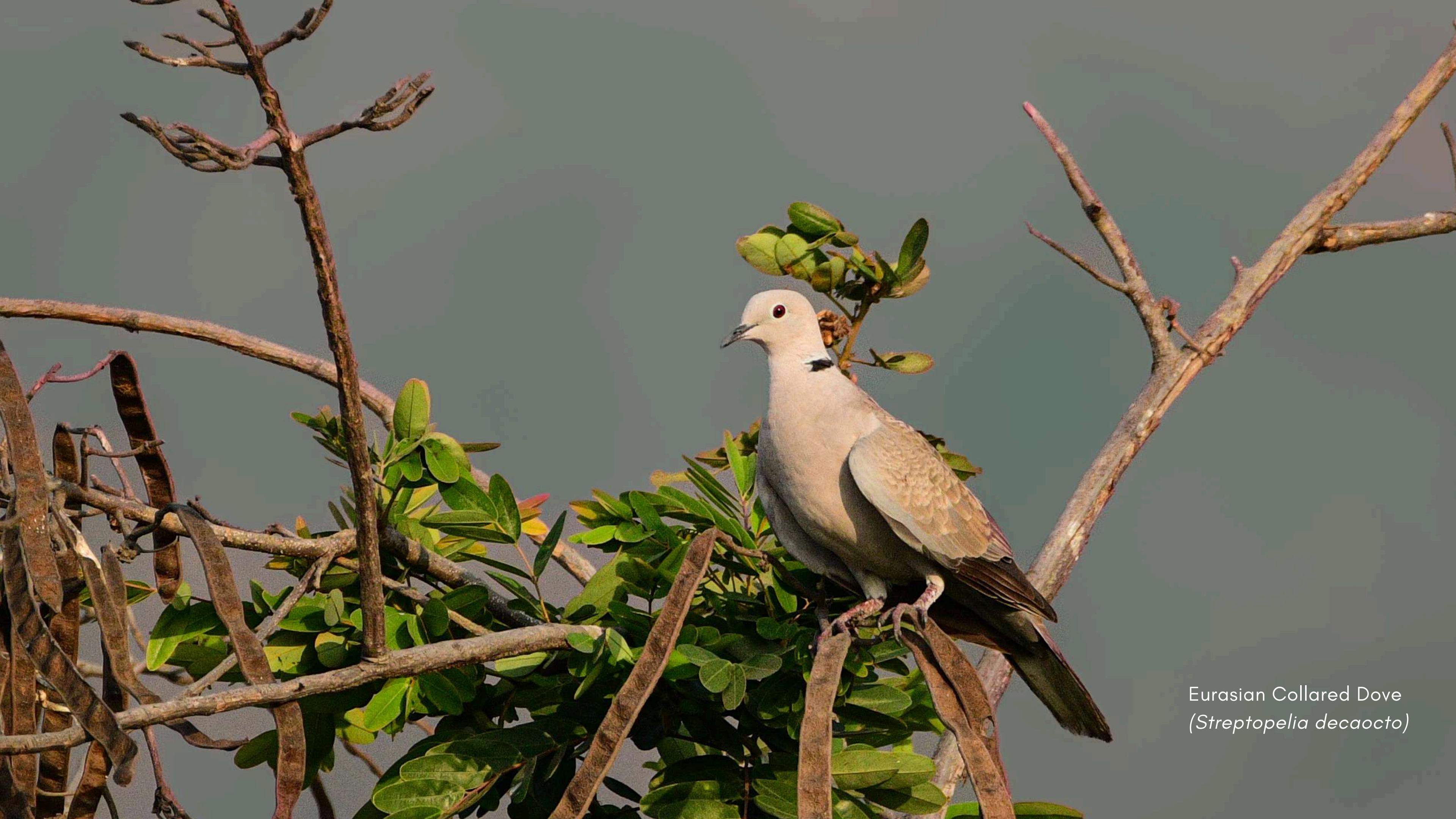
Eurasian Collared Dove ( Streptopelia decaocto )