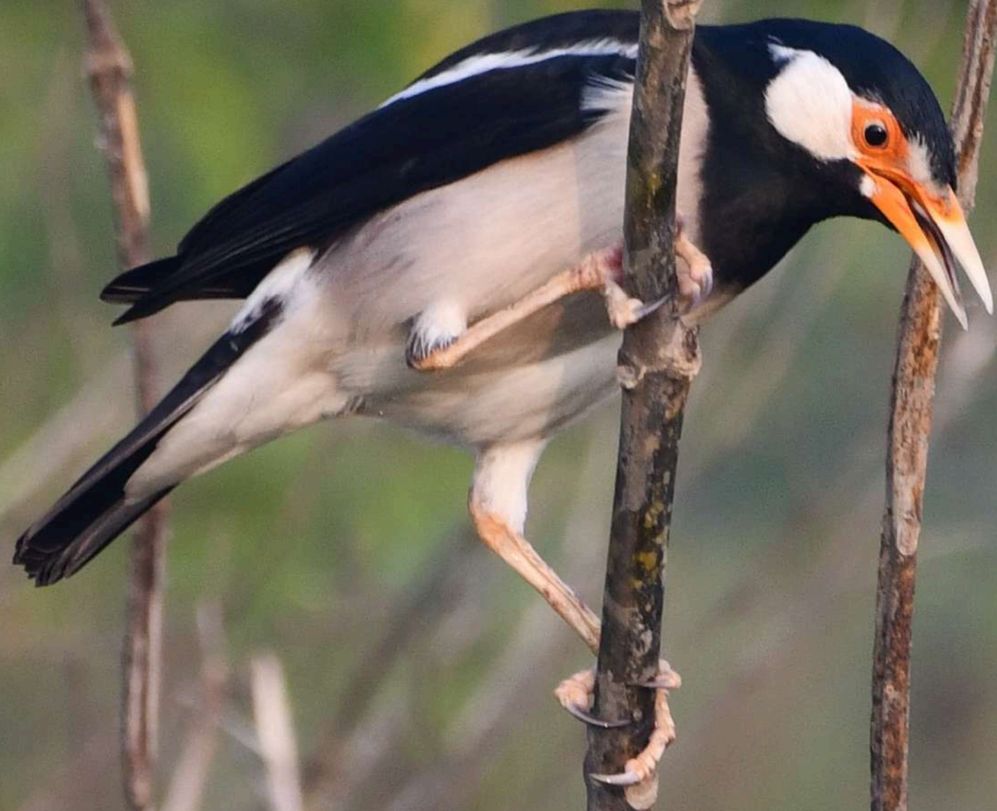
Indian Pied Myna ( Gracupica contra )