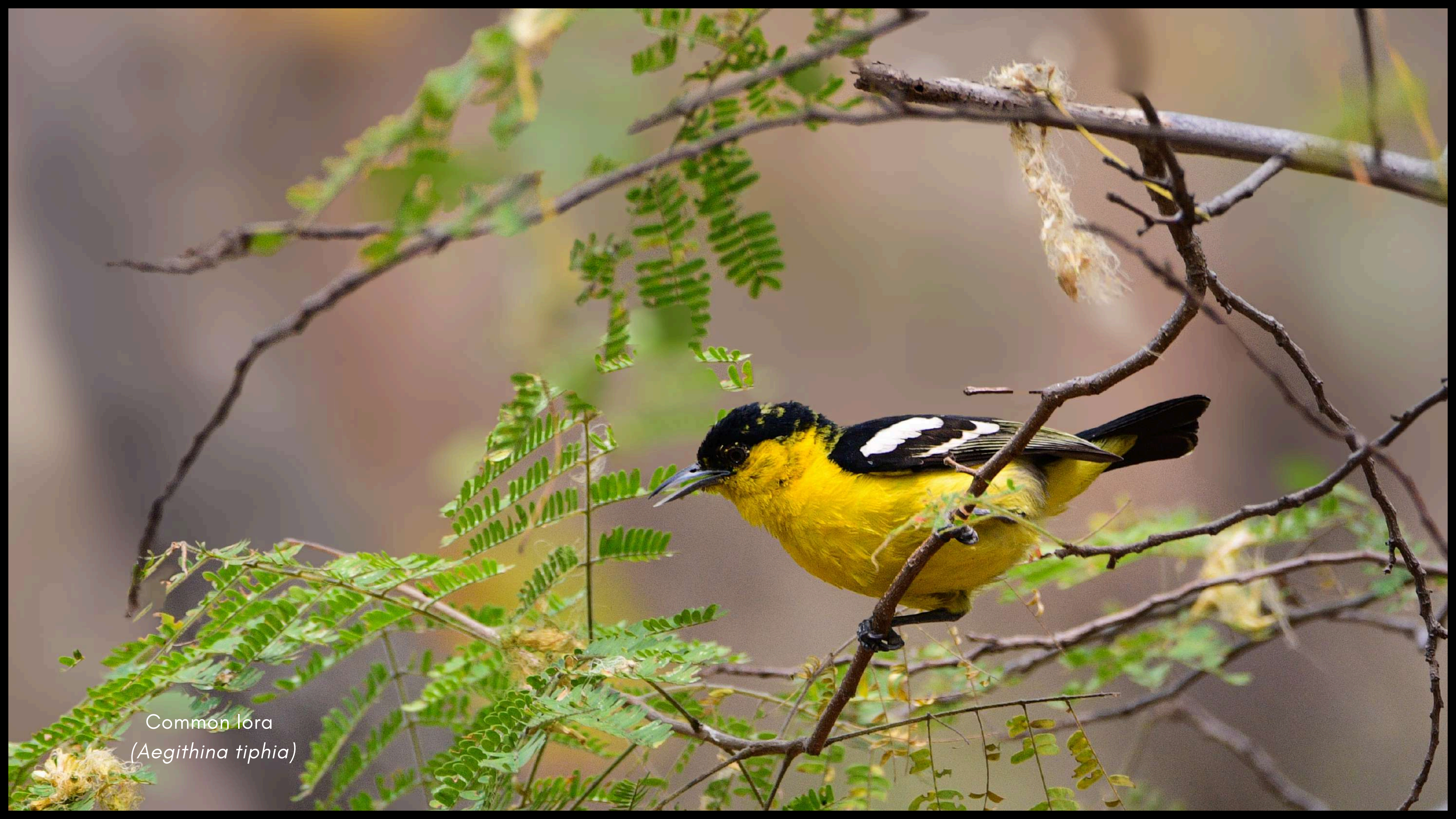
Common lora ( Aegithina tiphia )