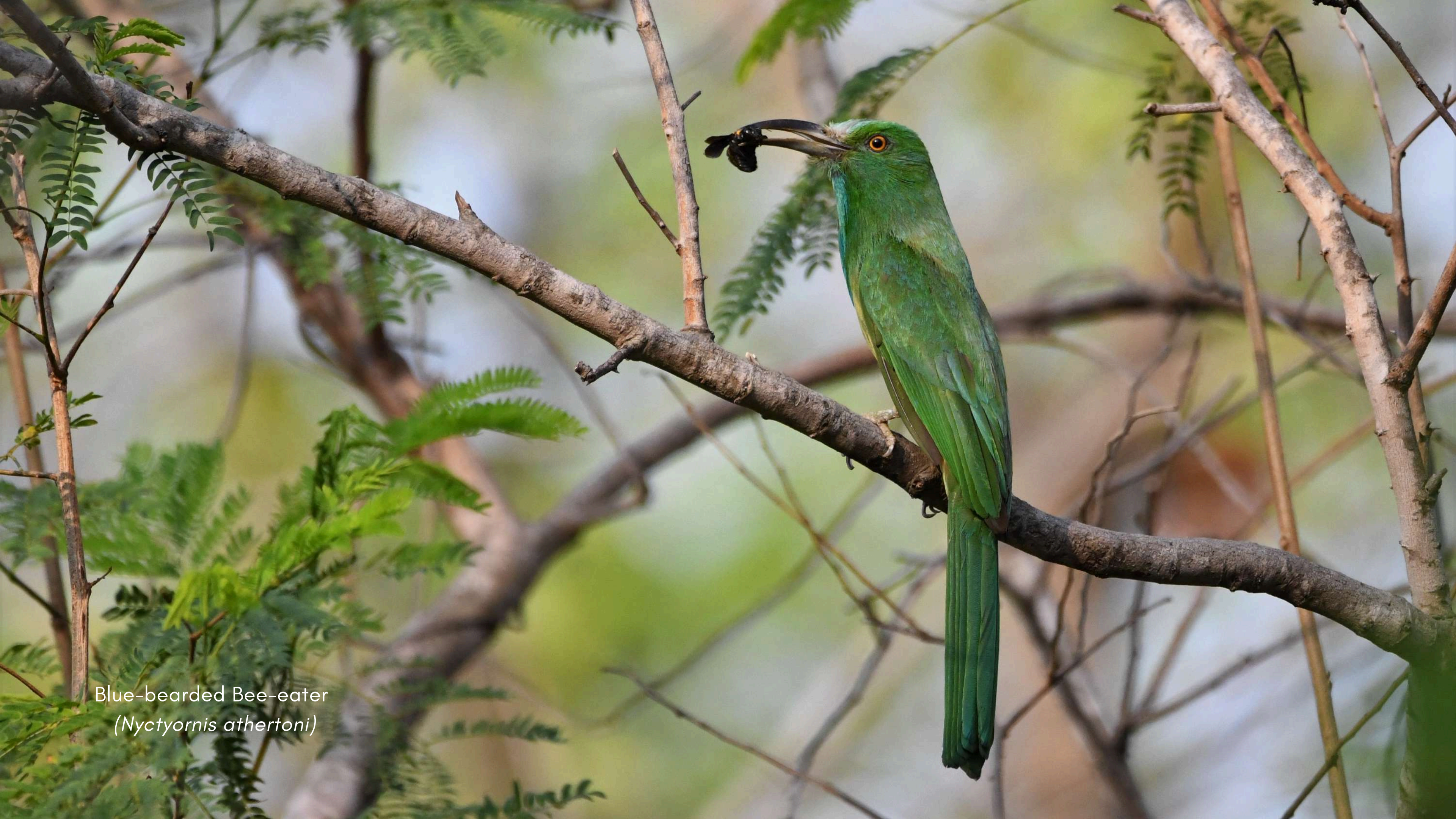
Blue-bearded Bee-eater ( Nyctyornis athertoni )